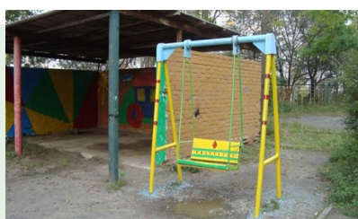
и после работы