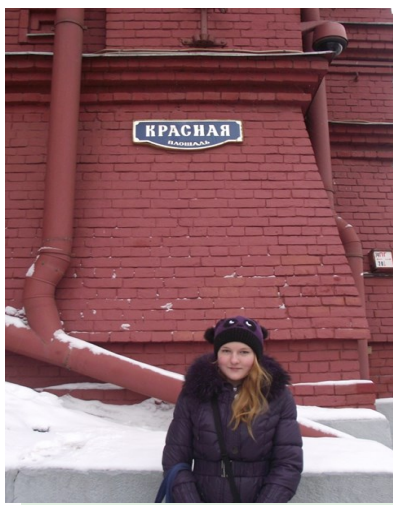
Экскурсия на Красную Площадь — самая незабываемая