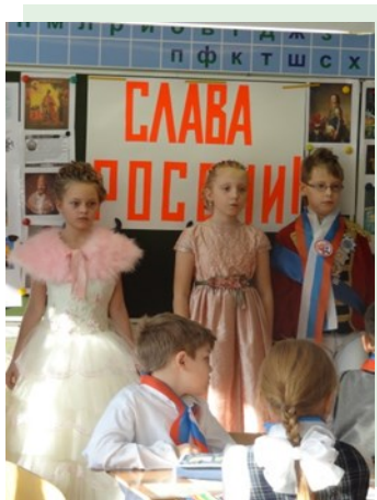
Фестиваль наук в ЗА

В третьей четверти в нашей гимназии прошёл первый Фестиваль Наук. Целую неделю ученики знакомились с новыми предметами, приобретали новые знания, встречались с учеными и состязались друг с другом.