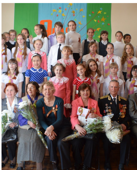
Закончился концерт совместной фотографией на память

После окончания концерта состоялись встречи ветеранов со школьниками 8, 7, 6, 3 классов. К сожалению, с каждым годом ветеранов микрорайона приходит все меньше и меньше. Поэтому учащиеся гимназии — волонтеры сами побывали у ветеранов в гостях с поздравлениями и подарками. Для детей это было незабываемо.