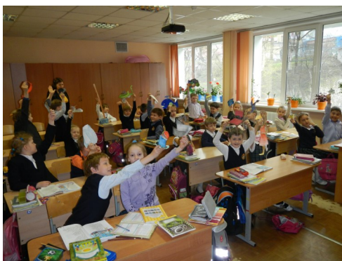
Ребятам 1Б понравилась идея не только прочитать, но и «поиграть в книжку»