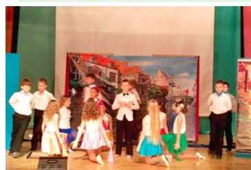
«Цветик - семицветик», 4А2