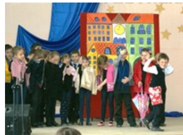
«Про Фому», 1Г