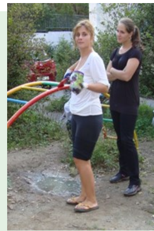
Настя за работой