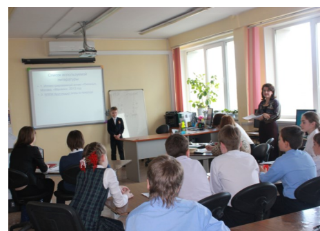
Тихо! Идёт защита работ!