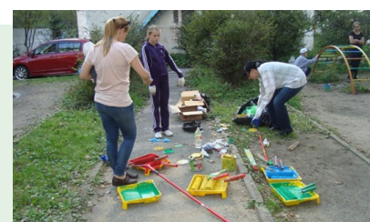
Родители — надёжные партнёры