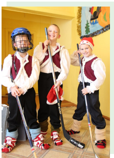
Счастливые улыбки детей были с нами на протяжении всего праздника.

Все люди в преддверии Нового года мечтают об исполнении всех своих самых заветных желаний. Именно поэтому группа волонтеров из нашей школы и от газеты «АИФ Приморье» решили сделать небольшое чудо для ребят из детского дома в поселке Ольга.